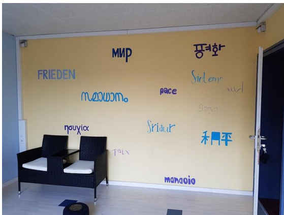
Abbildungen 6 - 8: künstlerische Optimierung