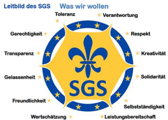
Abbildung 3: Schulleitbild des SGS

Unter Beachtung der Förderrichtlinien der Evangelischen Kirche im Rheinland und des Bistums Trier machte sich die Arbeitsgruppe an die Erstellung eines inhaltlichen Konzepts. Der Raum sollte der gesamten Schulgemeinschaft in all ihrer Pluralität zur Verfügung stehen, warm und gemütlich eingerichtet sein und einem Nutzungskonzept folgen, das Andachten, Stilleübungen, Morgenbesinnungen, Mediationen und seelsorgerliche Einzelgespräche umfasst. Die Regeln für die Nutzung des Raumes sollten sich dabei eng an den Werten orientieren, die in unser Schulleitbild eingeflossen sind: