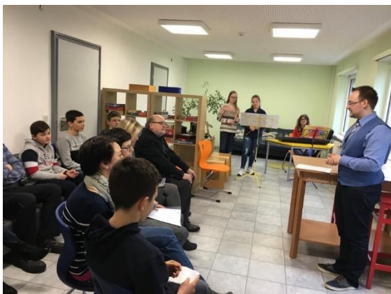
Abbildung 9: Einweihungsfeier

Am 14. März 2019 fand schließlich mit der Eröffnungsfeier der Projektabschluss statt. Wir erhielten eine musikalische Unterstützung durch einige Schulmusikerinnen und das Kuchenkomitee der Klassenstufe 11.