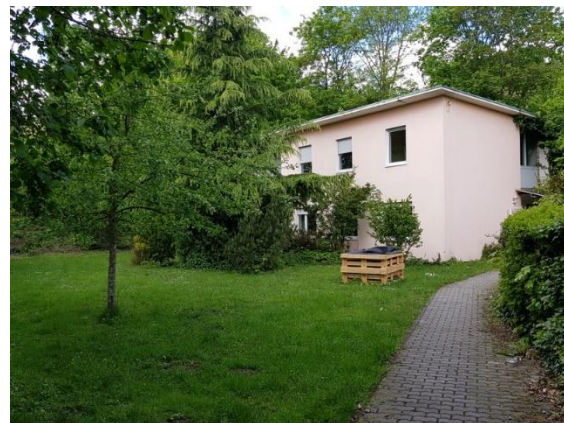
Abbildung 2: Villa Giardino

Die Villa liegt etwas abseits vom Hauptgebäude, fast schon verwunschen, wodurch sie als Rückzugsort vom Schulalltag geradezu prädestiniert ist.