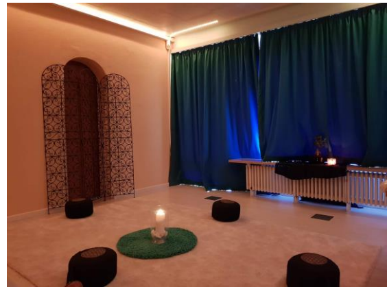
Abbildungen 4 & 5: „Raum der Stille“

und die nötigen handwerklichen Arbeiten erstellt. Mit Beginn des Schuljahres 2018/2019 erhielten wir Unterstützung durch die Fachschaft Deutsch, die gemeinsam mit dem Hausmeister das Ausräumen des Besprechungsraumes übernahm. Zusammen mit einigen Oberstufenschülern, einer Fachkollegin und unserer Schulleiterin setzte ich die Anschaffungswünsche nach und nach um. Von November 2018 bis Januar 2019 erfolgten mehrere konzertierte Etappen, in denen die Arbeitsgruppe mithilfe des angeschafften Mobiliars den „Raum der Stille“ einrichtete. Jegliche technischen und handwerklichen Arbeiten wurden von unserem Hausmeister äußerst zeitnah, kompetent und bereitwillig ausgeführt. Ein ortsansässiges Unternehmen für Inneneinrichtung passte uns die vorhandenen, brandsicheren Gardinen kostenfrei an die entsprechenden Raummaße an.